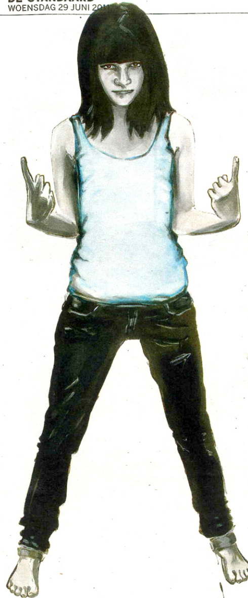
'Sans titre', 2009, Charlotte Beaudry. © Charlotte Beaudry

Godard. Het is een scène waarin jonge meisjes over hun opvattingen en verwachtingen worden ondervraagd. 'Het trof mij hoe weinig er veranderd is in veertig jaar', zegt Beaudry. 'Als je de antwoorden uit de film vergelijkt met wat de meisjes vandaag zeggen, merk je nauwelijks verschillen. Ze weten alles over moederschap en relaties en