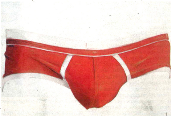
'Slip (rouge)', 2010, Charlotte Beaudry. © Charlotte Beaudry/Marc Wathieu

Beaudry focust op de figuur, al schildert ze die niet altijd ten voeten uit: vaak gaat het gelaat van het meisje schuil achter een bos haar, of snijdt ze een deel van de figuur weg. 'Een schilderij moet voor mij meer zijn dan een foto', zegt Beaudry. 'Het is juist de mogelijkheid om zelf klemtonen te leggen en naar de psychologie van het model te peilen die schilderen voor mij de moeite waard maakt.' Haar doeken wekken de indruk